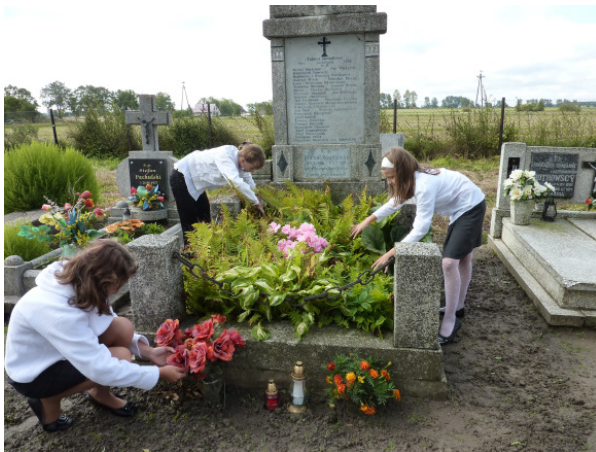
W 71 rocznicę wybuchu II wojny światowej uczniowie złożyli kwiaty i zapalili znicze na grobach bohaterów tamtych dni

Nauczycielom i pracownikom szkoły z okazji DEN